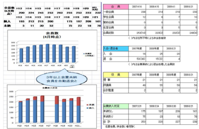
会員動向・会費納入状況

ホームページのバナー広告は現在 6 社と契約しており、1 社は半期契約で取り下げられたことが報告された。